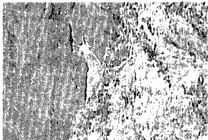
IN TV L'immagine dello stambecco al Tg1