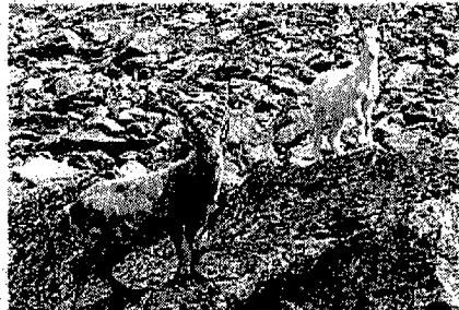
CON LA MADRE In compagnia della madre